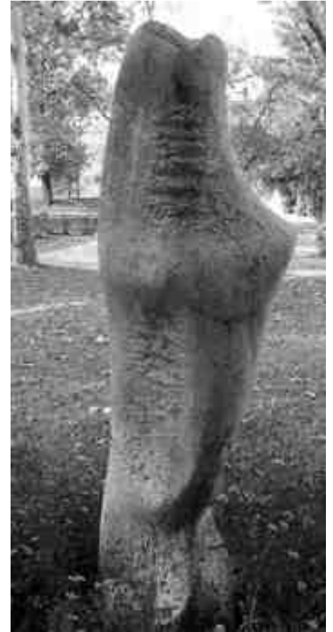
Bocz Gyula: Jégvirág