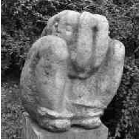
Rétfalvi Sándor: Kavicsasszony