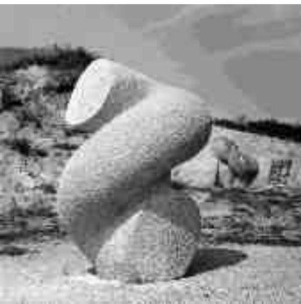
Bocz Gyula: Spirál