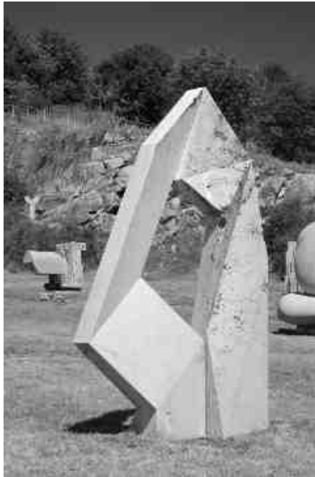
Böszörményi István: Egyárbócos

JPTE Képzőművészeti Mesteriskola, Bencsik István 75. születésnapja, egyéni művek