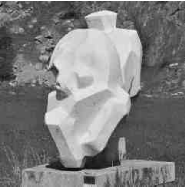
Mauno Kivioja: Cirkuszi ló

Új anyagok, figurális ábrázolások megjelenése