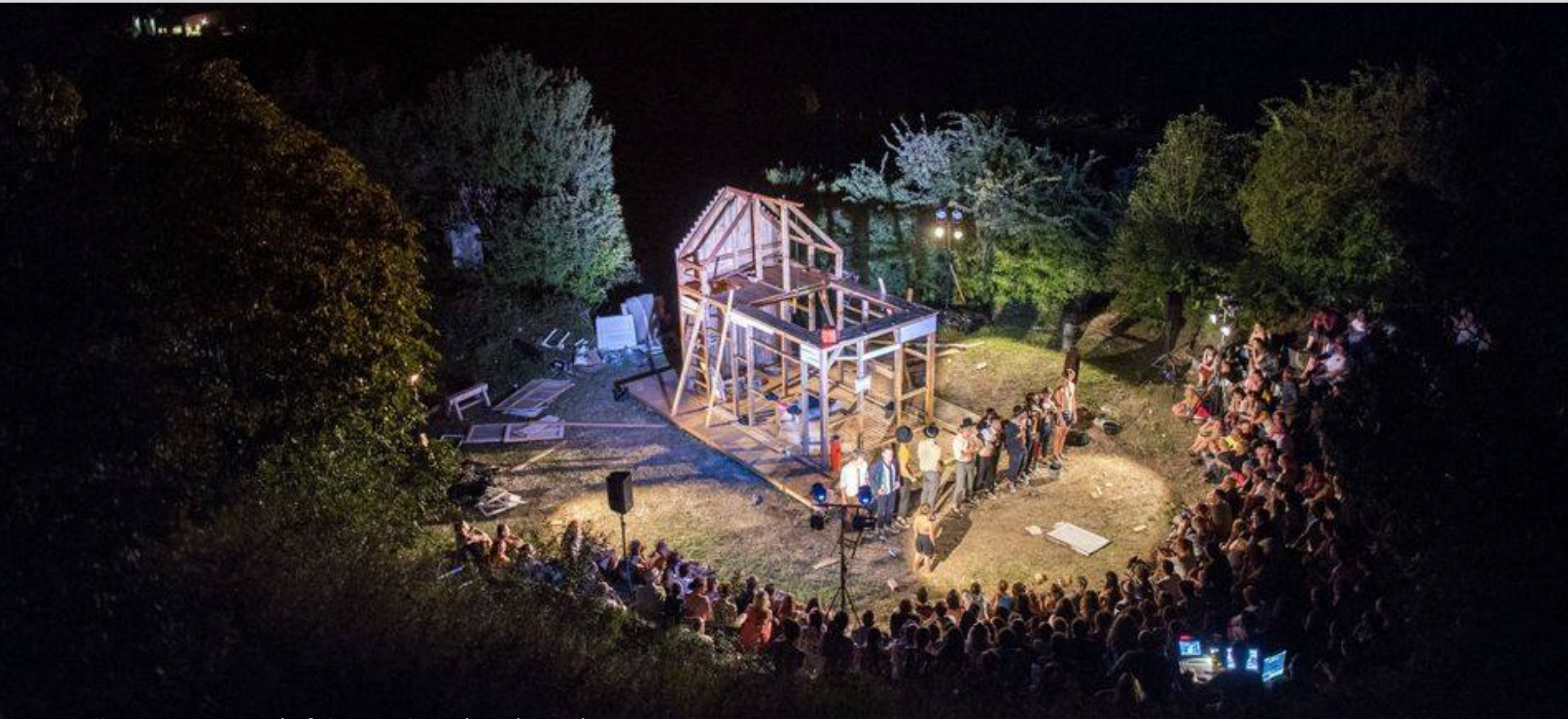
Sztalker Csoport: Míg fekszem kiterítve (2018)