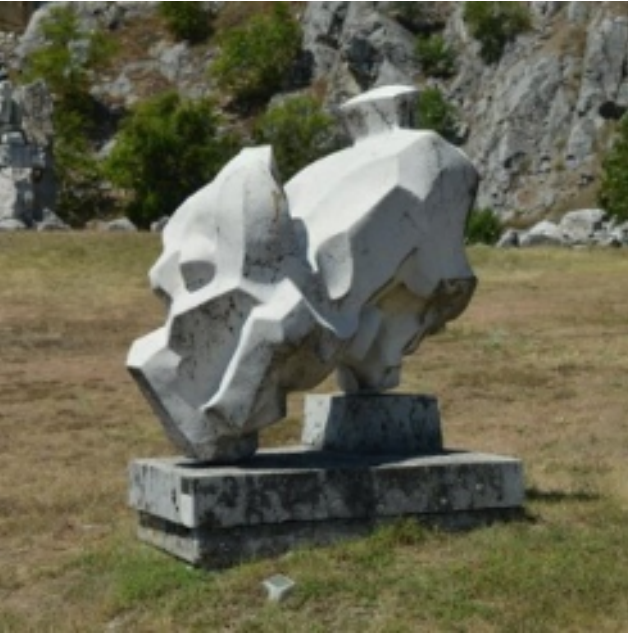
Mauno Kivioja: Cirkuszi ló