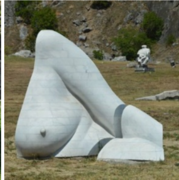
Bencsik István: Európa