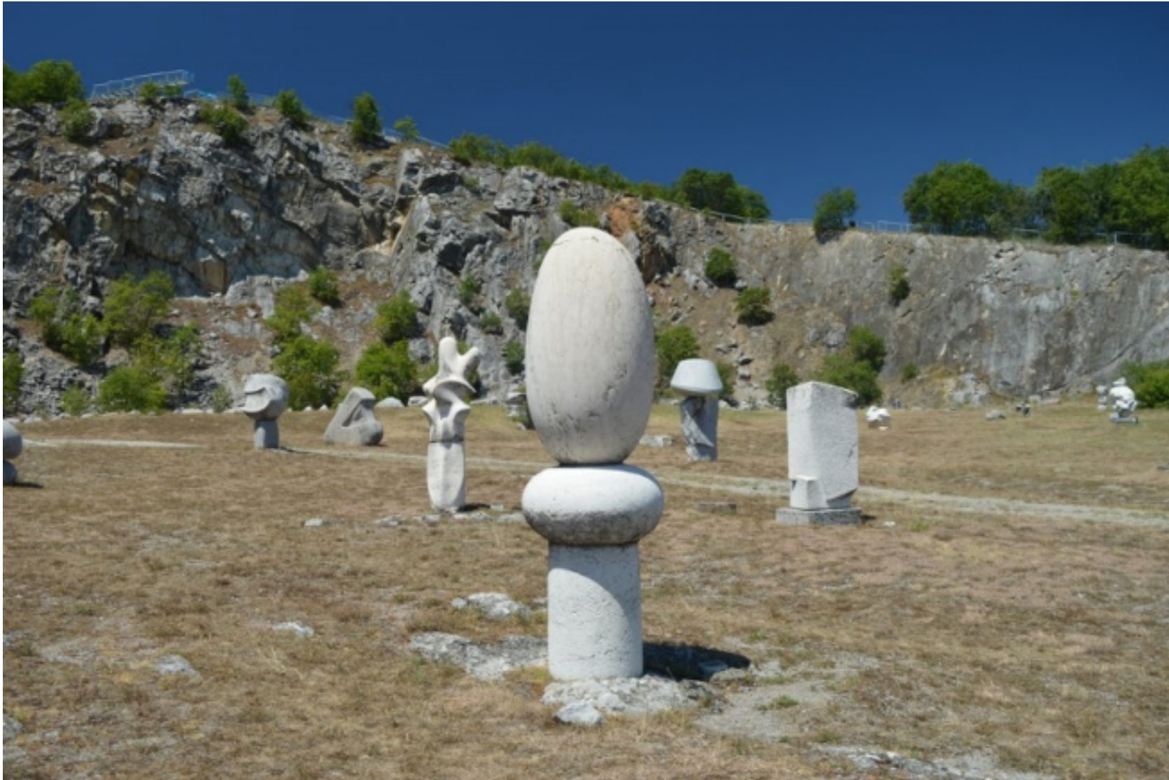
Bencsik István: Kolumbusz tojása