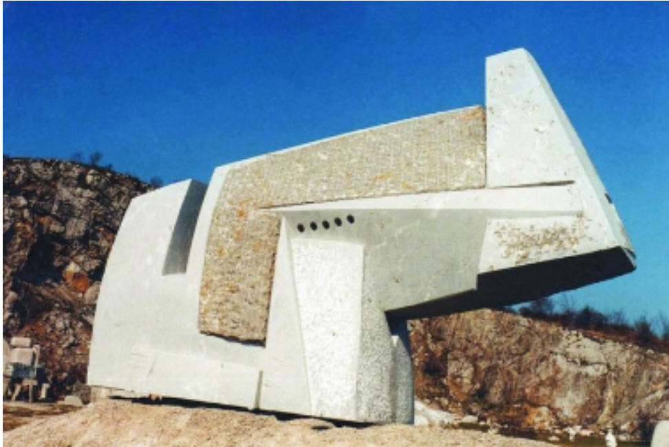
Horváth Ottó: Tér-hajó-állat (1996)

JPTE Képzőművészeti Mesteriskola és egyéni művek