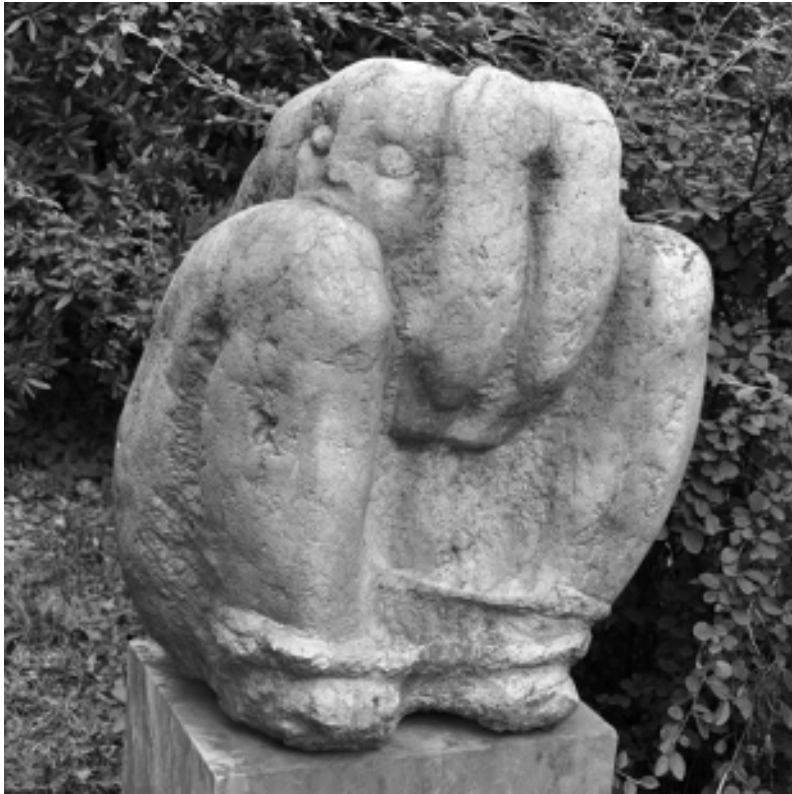
Rétfalvi Sándor: Kavicsasszony