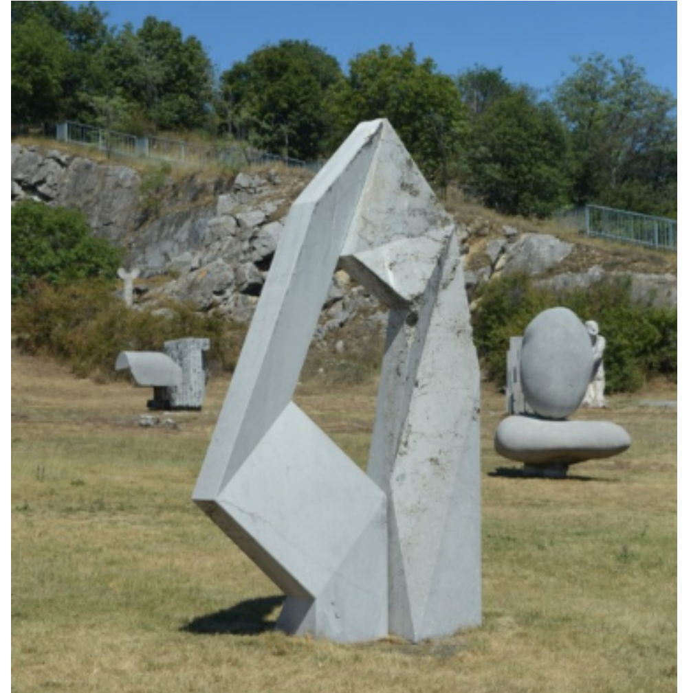
Böszörményi István: Egyárbócos (1994)

2005-2006: Bencsik István 75. születésnapja alkalmából készült szobrok Pécs, Aradi Vértanúk Útja