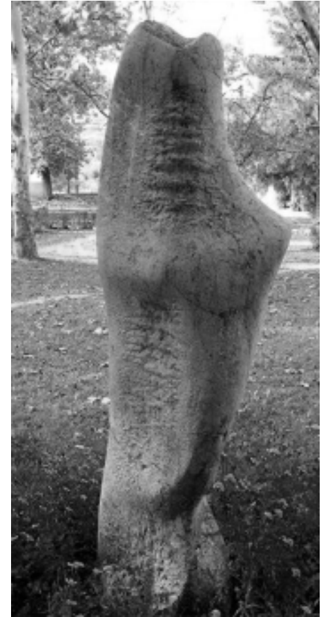
Bocz Gyula: Jégvirág