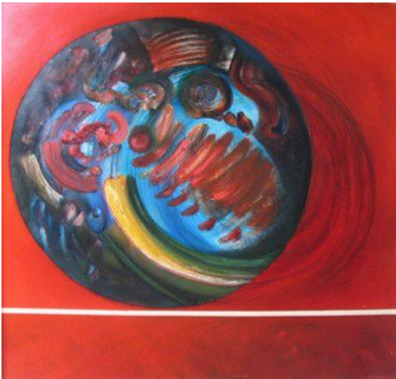
Torok Sándor: Hortobágyi Metamorfózis, 1978