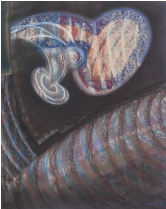
Torok Sándor: Cantata Cosmica V., 1973

Torok Sándor(1) a vajdasági és magyar képzőművészet jelentős egyénisége, aki mintegy négy évtizedes alkotótevékenysége során gazdag és kiegyensúlyozott életművet hozott létre.