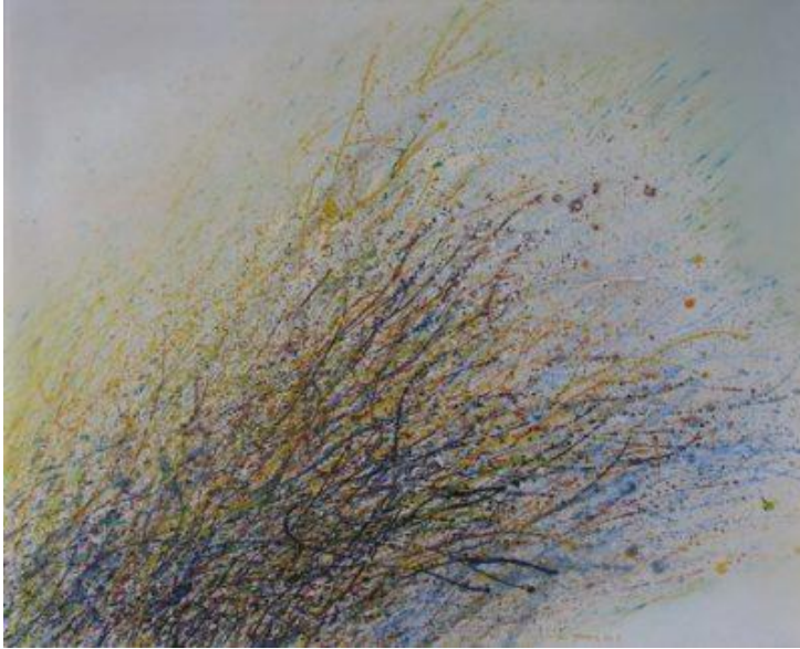
Torok Sándor: Júliusi szél II., 1990

A lírai absztrakció útján, a közvetlenül megtapasztalható földi világból a kozmikus kiterjedések képzeletbeli látomásainak irányába haladva tehát Torok „hiteles és ilyenként hihető, igaz egyéni világot konstruált”, amelyben maga az ember ugyan nem volt látható, „de annál erőteljesebben feszültek benne azok a dinamikus erőmozgások, amelyek az emberi életet is áthatják a maguk láthatatlan, de nagyon is érezhető halmazállapotában. Merész, nagy léptékű látomások voltak ezek, melyeknek nyomán nyelvi értelemben is kialakult a sajátos toroki beszédmód, a stilisztikai jegyek máig érvényes egyedi rendszere.”(14) Erő, rend, fegyelem, egyensúly, harmónia és fenyegetettség, líra, lendület és dinamika együtt van jelen e toroki világban, ez teszi munkásságát időtől függetlenül élvezhetővé, aktuálissá és megkerülhetetlenné. Műveinek filozófiája „a mechanikus és organikus létezők egymáshoz való viszonyát boncolgatja, a rideg gépszerű, mérnökiek kiszámított geometrikus formákat oltja a szabad, esetleges formákba” – tapint rá érzékenyen Bartkó Péter Szilveszter.(15) Torok szinte mindig visszatérő motívuma a csavarkulcsszerű komponens, mint emberi konstrukció, gép, a természettől eltávolodott ember mesterséges világának teremtőeszköze.