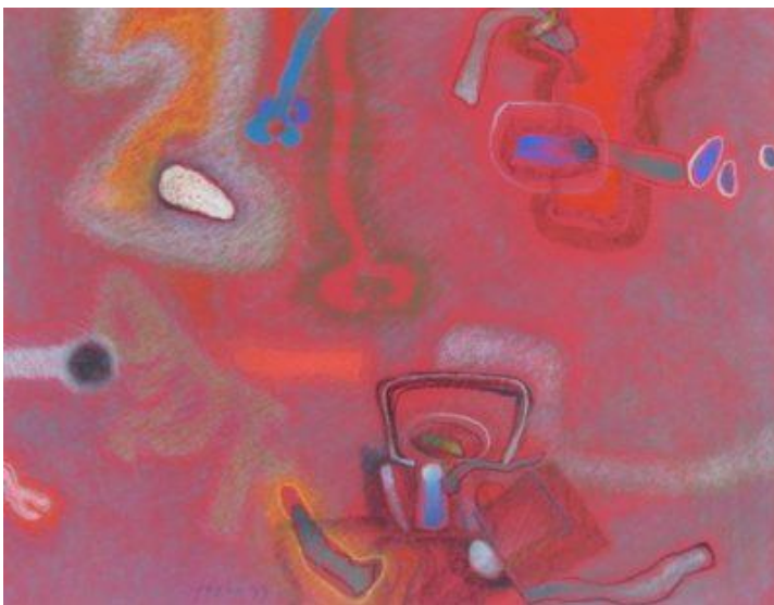
Torok Sándor: Nyári formák I., 1999

A lírai absztrakció útján, a közvetlenül megtapasztalható földi világból a kozmikus kiterjedések képzeletbeli látomásainak irányába haladva tehát Torok „hiteles és ilyenként hihető, igaz egyéni világot konstruált”, amelyben maga az ember ugyan nem volt látható, „de annál erőteljesebben feszültek benne azok a dinamikus erőmozgások, amelyek az emberi életet is áthatják a maguk láthatatlan, de nagyon is érezhető halmazállapotában. Merész, nagy léptékű látomások voltak ezek, melyeknek nyomán nyelvi értelemben is kialakult a sajátos toroki beszédmód, a stilisztikai jegyek máig érvényes egyedi rendszere.”(14) Erő, rend, fegyelem, egyensúly, harmónia és fenyegetettség, líra, lendület és dinamika együtt van jelen e toroki világban, ez teszi munkásságát időtől függetlenül élvezhetővé, aktuálissá és megkerülhetetlenné. Műveinek filozófiája „a mechanikus és organikus létezők egymáshoz való viszonyát boncolgatja, a rideg gépszerű, mérnökiek kiszámított geometrikus formákat oltja a szabad, esetleges formákba” – tapint rá érzékenyen Bartkó Péter Szilveszter.(15) Torok szinte mindig visszatérő motívuma a csavarkulcsszerű komponens, mint emberi konstrukció, gép, a természettől eltávolodott ember mesterséges világának teremtőeszköze.