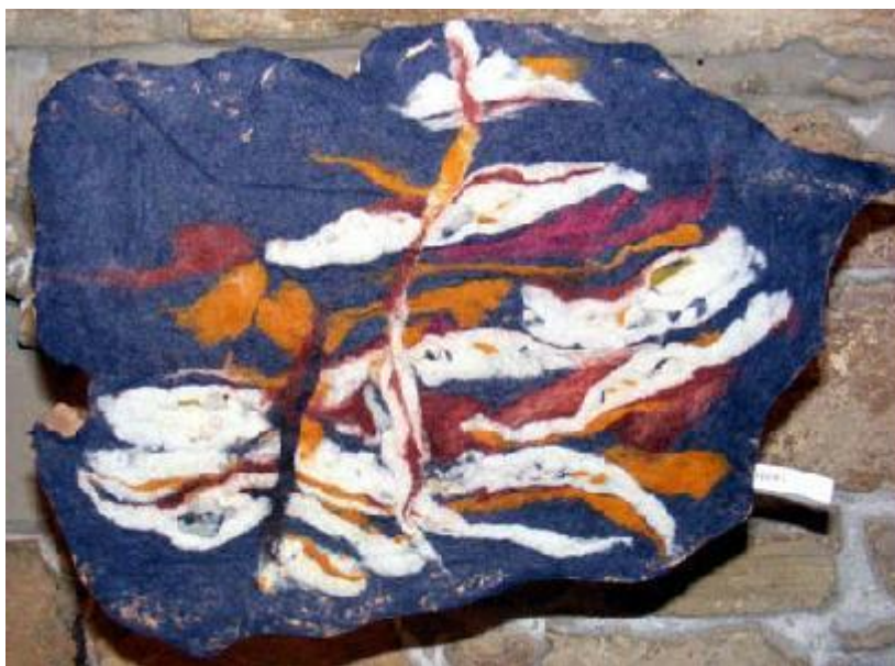
Kányási Holb Margit: Felhők II.

Egy művészpár, más-más anyagban, más-más stiláris megközelítésben megfogalmazott világértelmezése. Két autonóm alkotó, akiket azonban – hasonló alapállásukból fakadóan – ugyanazon művészi törekvés jellemez: a világ időbe ágyazottságának kutatása, tovább gondolása.